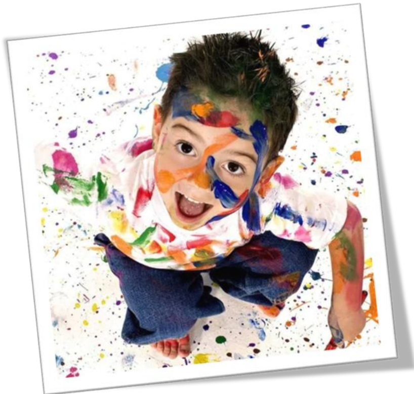
Az önkifejezés pillanatképei

Játéka - szabadjátéka: kedvelt játéktémák