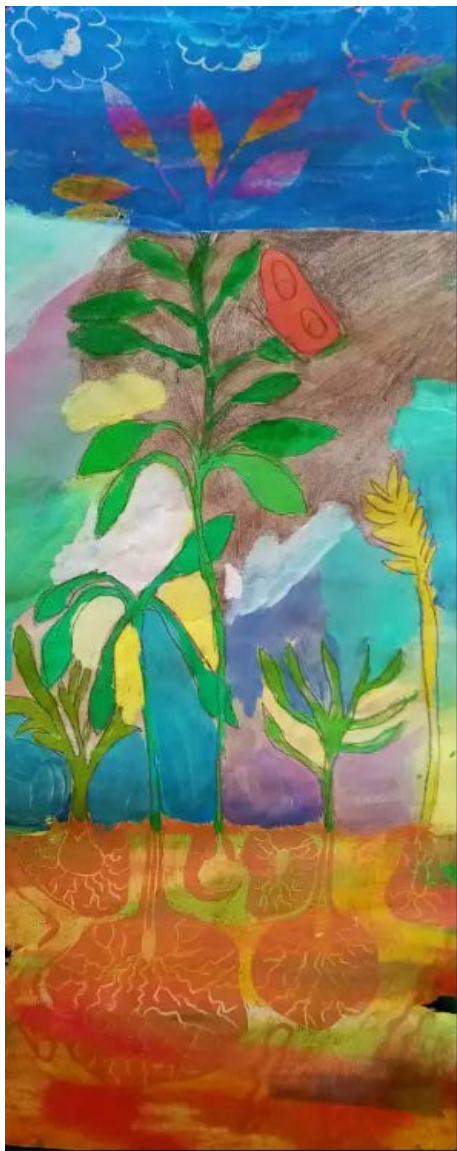
Fernye Dalma: "Ég és föld között"