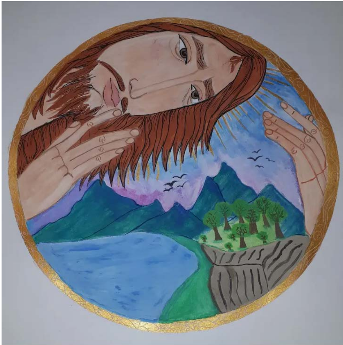
Bana Janka: Oltalom