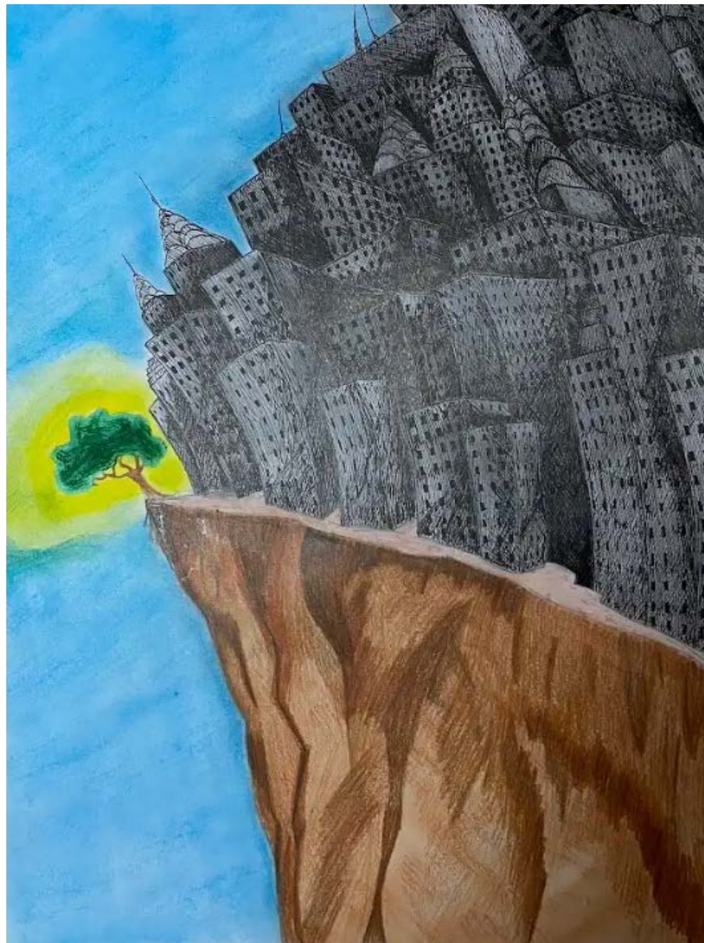
Horváth Luca: Elvárosiasodás