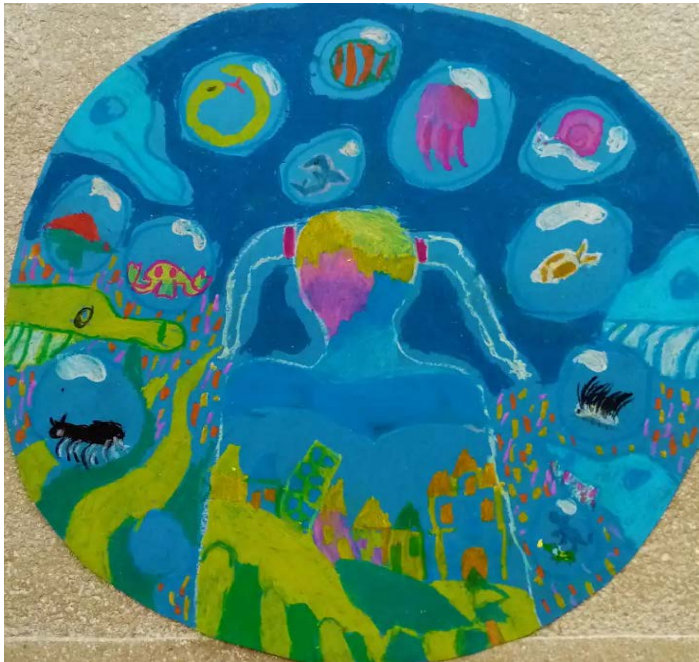
Koncz Zsófia Naomi: "Buborékba zárt világ"