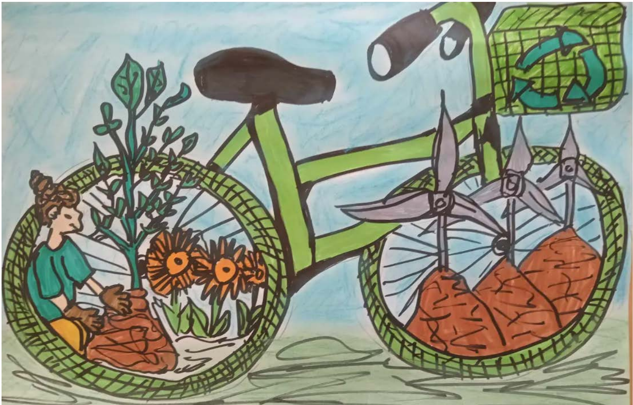
Süveges-Győrfi Janka: Gyermekszemmel a teremtésvédelemről