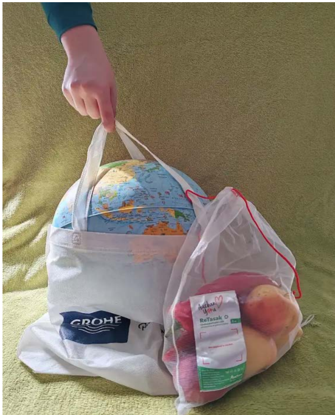
Kocsis Boldizsár András: Nejlon STOP!