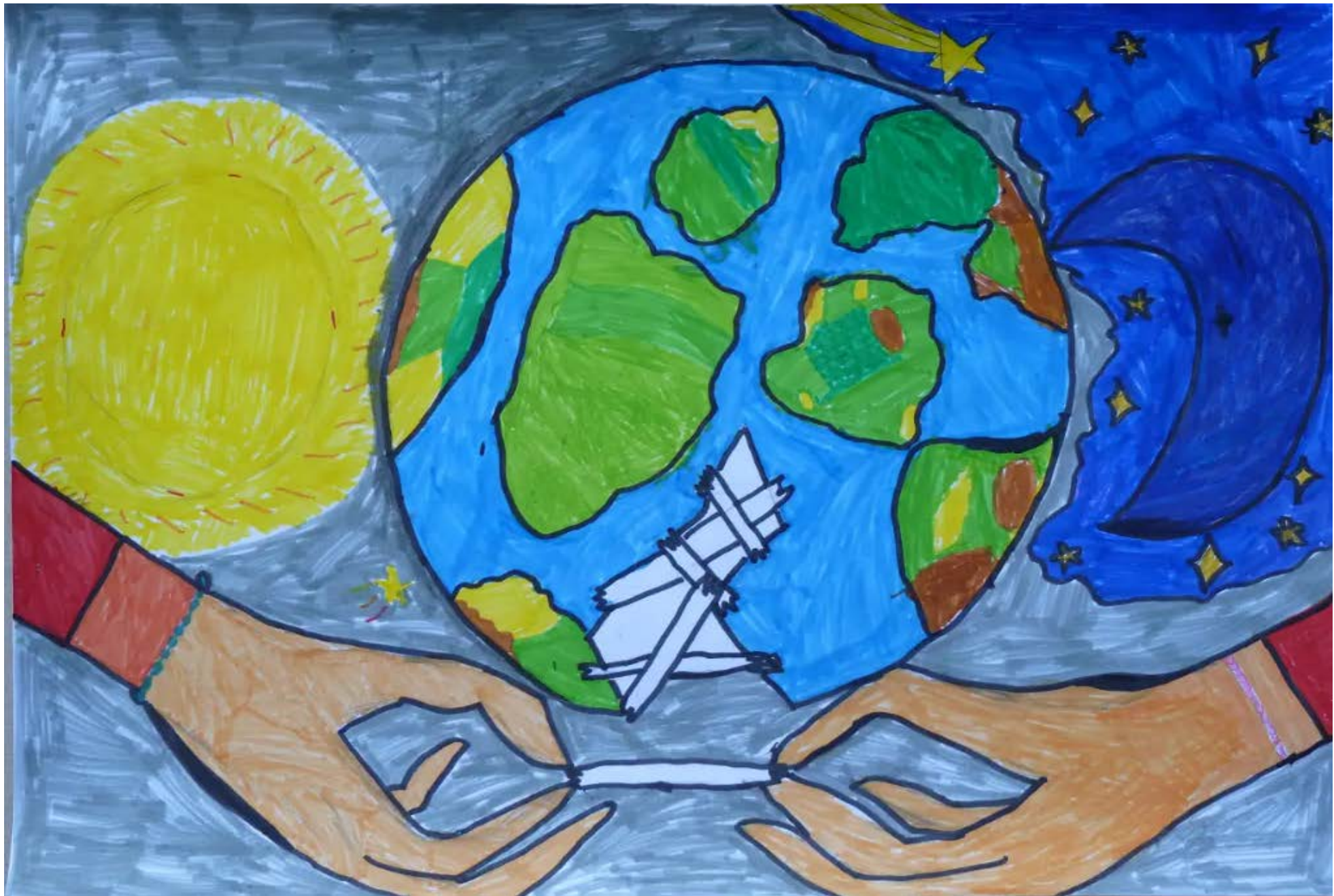
Novák Jázmin: Gyógyítsuk meg a Földet!