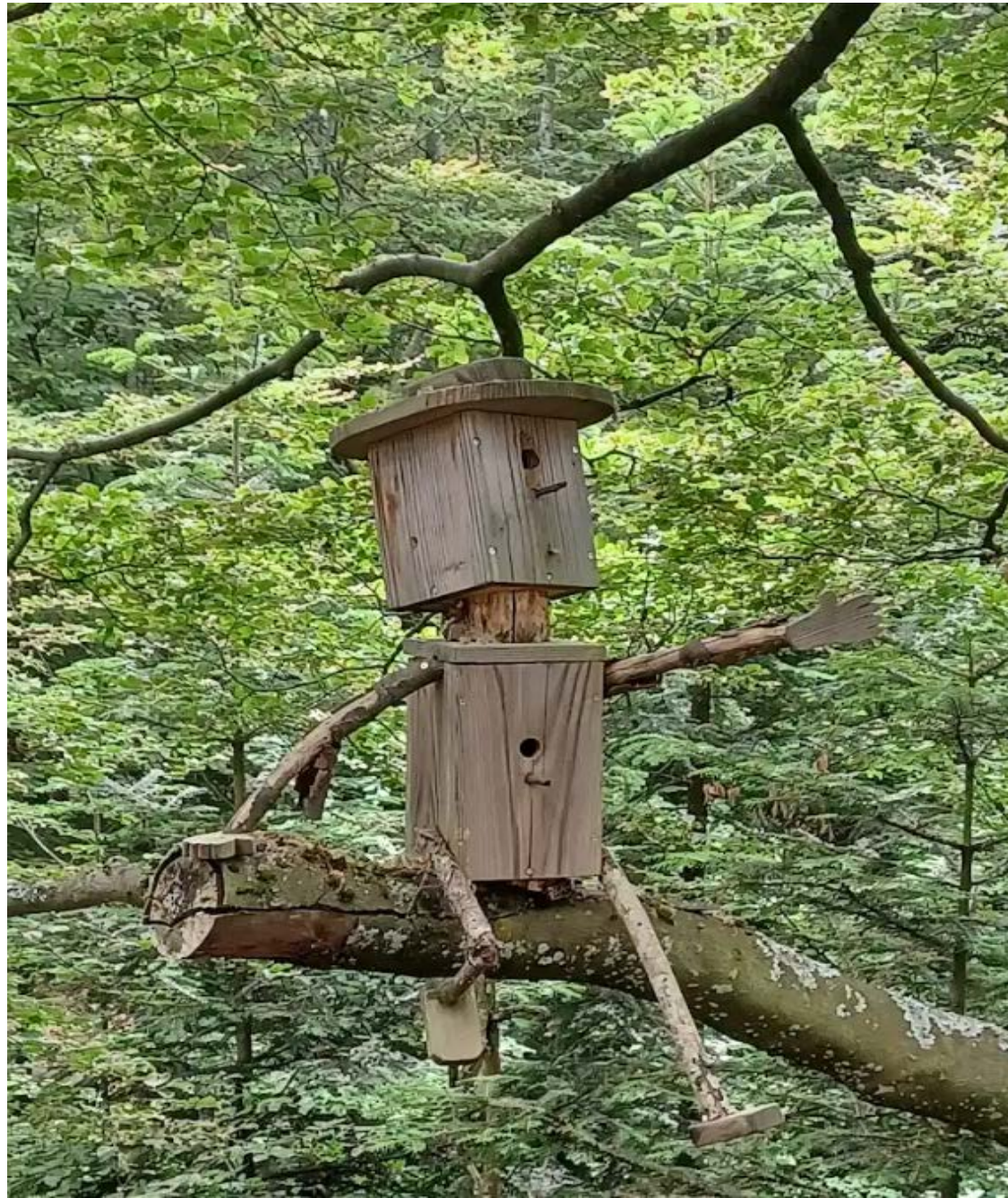
Flosznik Roland: Madárszálló