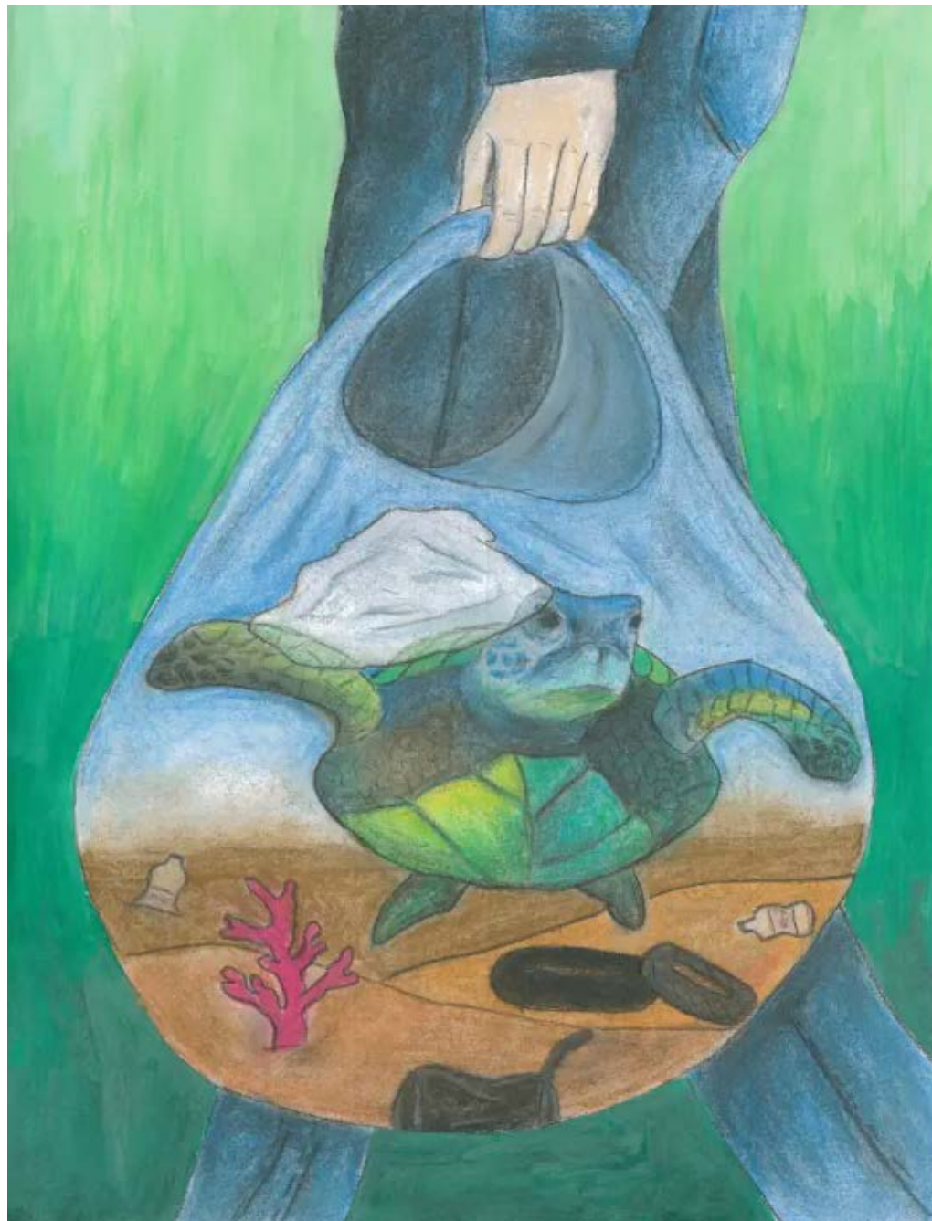
Szabó Kitti: Segítség