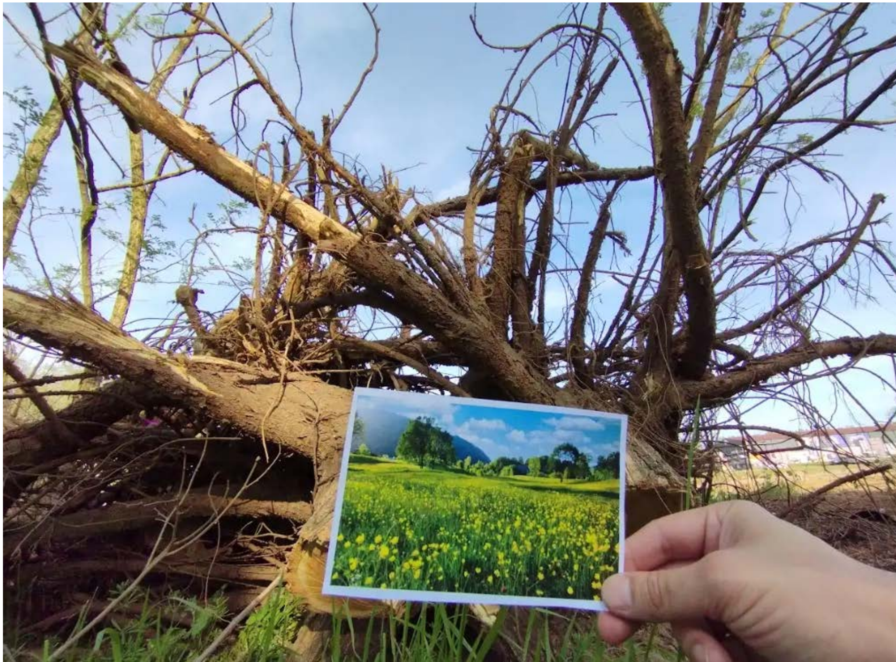
Béres Kristóf: Tótágast áll a természet